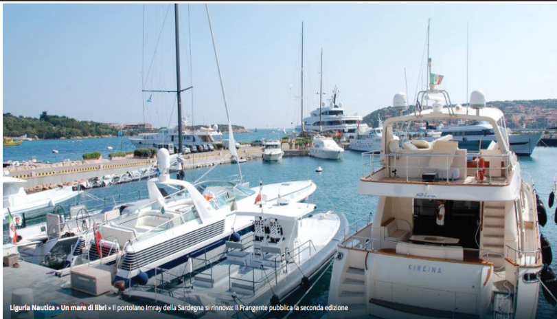
Liguria Nautica • Un mare di libri • Il portolano Imray della Sardegna si rinnova: Il Frangente pubblica la seconda edizione