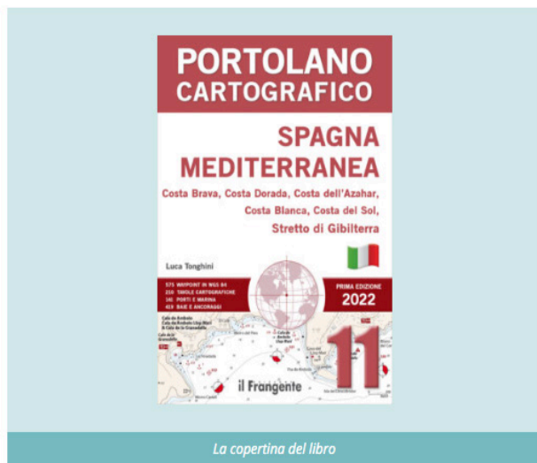
La copertina del libro

La consultazione è semplice e può avvenire sia prima che durante la navigazione, per programmare in anticipo la crociera o per trovare l'approdo migliore, in un marina o in una baia, durante la notte.