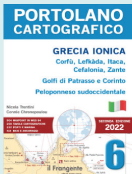
Portolano cartografico 6