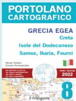
Portolano cartografico 8