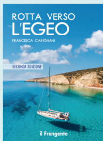
La copertina del libro

Insieme a Giovanni, suo compagno di vita da sempre, nel 2011 sceglie di cambiare barca e di girare il Mediterraneo, e in particolare l'Egeo, per una lunga stagione. Oggi vi tornano per la quarta volta, a completare con una nuova rotta la loro collezione di immagini e sensazioni, pensando sempre a nuovi orizzonti ma, ogni volta, richiamati "a casa" dalle sirene di Ulisse.