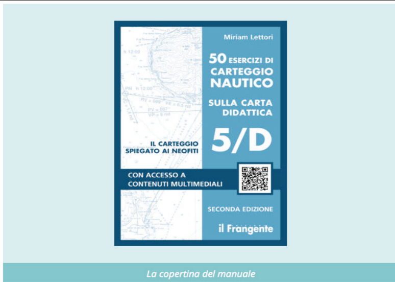
La copertina del manuale