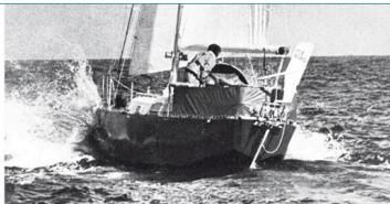
Ice Bird alla partenza da Sydney per l'Antartide.