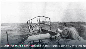
Daily Nautica - Un mare di libri - Eccezionale e controverso: la storia di David Lewis detto "The Dolphin"