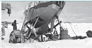
Ice Bird nella stazione americana Palmer in Antartide.