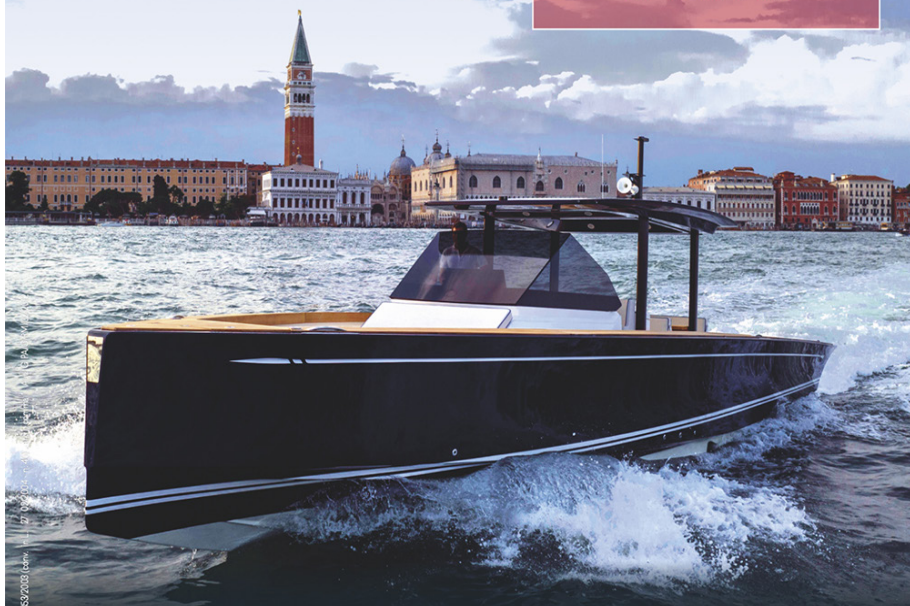
Spazio: in abbonamento postale - D.L. 35/2013 (conv. in L. 59/2013)