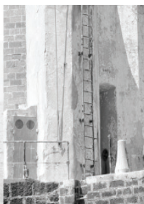
La porta che consente l'accesso al faro.