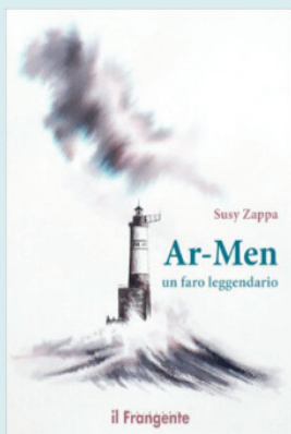
La copertina del libro

"La magia del faro" è invece il racconto di un'esperienza solitaria e di un viaggio onirico. Vivere in un faro permette di godere dei profumi intensi portati dal mare in tempesta, una ricerca interiore tra i moti ondososi e i giochi di luce, nei quali, a volte, la scrittrice rispecchia i propri stati d'animo.