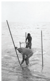
L'inizio dei lavori di costruzione.