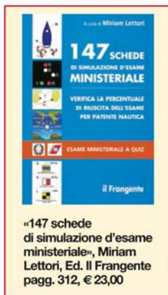
«147 schede di simulazione d'esame ministeriale», Miriam Lettori, Ed. Il Frangente pagg. 312, € 23,00

Quiz App Nautica per le esercitazioni sui device elettronici. Trovate maggiori informazioni sul sito: www.patente.it .