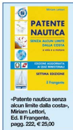
«Patente nautica senza alcun limite dalla costa», Miriam Lettori, Ed. Il Frangente, pagg. 222, € 25,00

ed efficace, supportata da una moltitudine di immagini e disegni a colori. Ovviamente più spartano è il libro dei quiz, articolato su 112 schede per l'esame entro 12 miglia e 35 per quello senza alcun limite. I risultati sono in fondo al volume: le soluzioni sono raggruppate in 10 schede e per ciascun gruppo è possibile calcolare la percentuale di probabilità di riuscita dell'esame sulla base delle risposte esatte e degli errori commessi. Ricordiamo che l'esame per la patente nautica entro