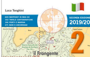
La seconda edizione del Portolano Cartografico 2

Mar Ligure Tirreno settentrionale Corsica Nord Sardegna