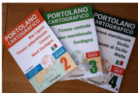
I tre portolani di Edizioni Il Frangente

Così come la partenza di qualsiasi uscita in mare, anche l'atterraggio richiede una certa preparazione da parte del comandante. Che si tratti di un natante o di un maxi yacht, al di là del programma di crociera, prima di dirigere la prua verso un qualsiasi approdo , baia o porticciolo, bisogna conoscere con precisione la natura del fondale, eventuali pericoli, modalità di accesso e molto altro.