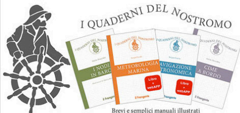
Brevi e semplici manuali illustrati