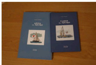
L'Agenda e il Planner del Marinaio di Davide Besana

Vi aspetta una settimana piena di impegni? Il fine settimana è vicino e, se ad attendervi ci sarà un'uscita in barca o una veleggiata di mezza giornata, a ricordarvelo saranno i disegni dell'inconfondibile matita di Davide Besana .