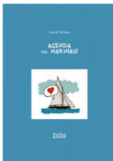
Agenda del Marinaio 2020