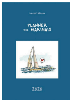
Planner del Marinaio 2020