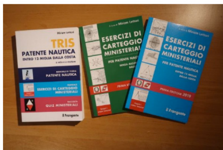
I volumi di Edizioni Il Frangente per la patente nautica

Il volume azzurro (entro le 12 miglia) raccoglie tutti gli esercizi di carteggio che dal 1° marzo 2016 vengono proposti in sede d'esame. La prima parte introduttiva è propedeutica ed è mirata all'apprendimento della tecnica di carteggio, con spiegazioni basilari per il neofita.