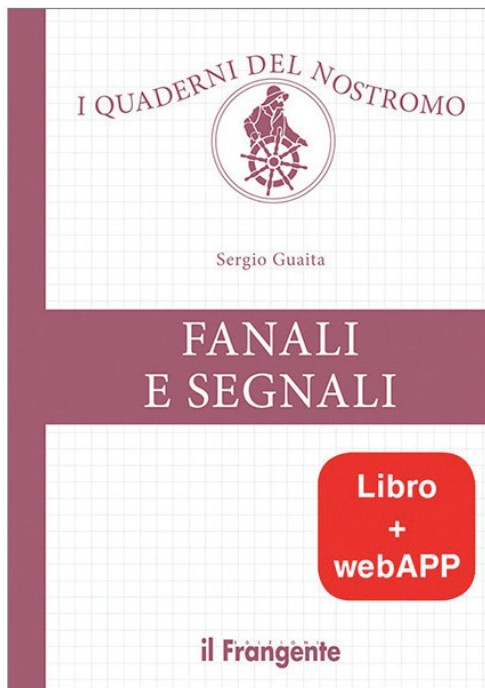
La copertina del libro