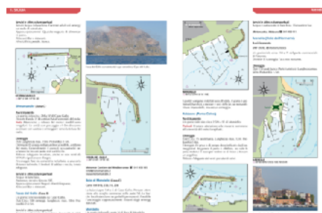
L'interno del portolano

Quello che si chiede a un qualsiasi portolano sono precisione, chiarezza, facilità di consultazione e informazioni aggiornate quanto più possibile.