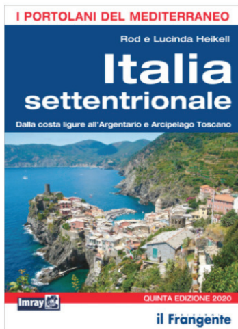
La copertina del portolano Imray dedicato all'Italia settentrionale

Il portolano dedicato all'Italia meridionale descrive invece le coste del Mar Tirreno centrale e meridionale e del Mar Ionio fino a Santa Maria di Leuca . La costa tirrenica è ricca di approdi ed offre scenari di grande bellezza naturale e di grande interesse storico e archeologico. Non sono da meno le numerose isole che la fronteggiano, con le Pontine , l'isola d' Ischia e Capri , vere perle del Mediterraneo, che richiamano un turismo nautico internazionale.