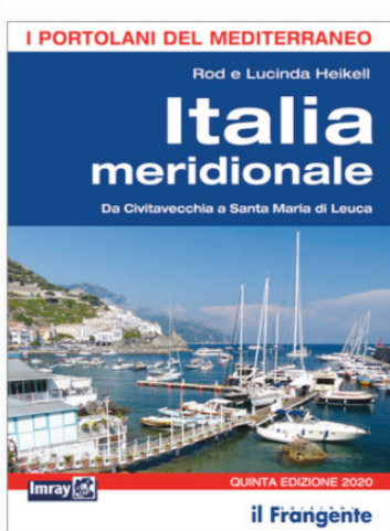
La copertina del portolano Imray dedicato all'Italia meridionale

Lascia la carriera accademica in Inghilterra e per pura curiosità acquista " Roulette ", uno sloop di 20' in legno degli anni '50, con il quale scende in Mediterraneo . Collabora con una società charter fino a quando, del tutto inconsapevole della portata dell'impresa, si cimenta nella stesura di una guida nautica sulla Grecia. A questa ne seguono altre, che descrivono le coste degli altri Paesi del Mediterraneo.