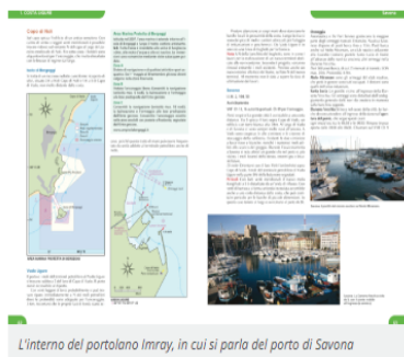
L'interno del portolano Imray, in cui si parla del porto di Savona

A raccontare il successo de "I Portolani del Mediterraneo" di Imray è la loro storia. Se una casa editrice specializzata nella nautica come Edizioni Il Frangente arriva a pubblicare la quinta edizione di due volumi che racchiudono tutta l'Italia da navigare, settentrionale e meridionale, è perché ci troviamo di fronte a una serie di manuali affidabili e precisi.