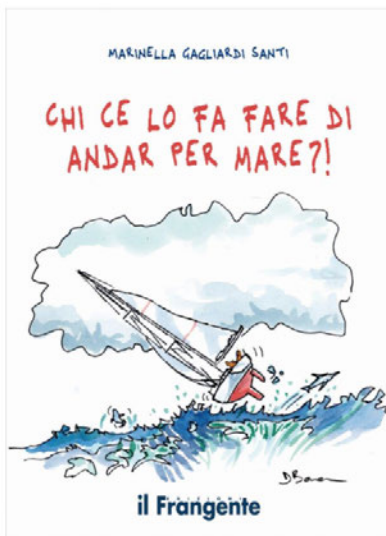
La copertina del libro