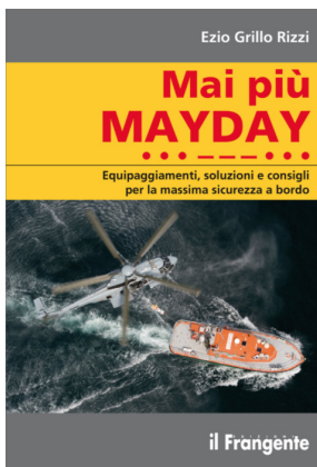
La copertina del libro

Poco più che ventenne, inizia la sua attività di skipper professionista e collabora con l'agenzia charter Albatross. Questo è il suo periodo più formativo in cui ha la possibilità di organizzare crociere anche al di fuori del Mediterraneo e di sperimentare e aprire varie rotte e zone da charter ai Caraibi, nel nord del Venezuela, in Malesia, Thailandia e Madagascar.