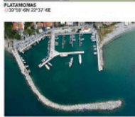
Il porto di Platomonas. Mappa Aisone