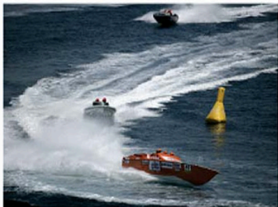
Migliorano le prestazioni di Jolly Drive, ma il divario dagli avversari resta elevato.