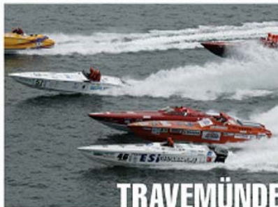
L'inglese Buzz/Butler domina le gare e il campionato; per Jolly Drive è una distana.